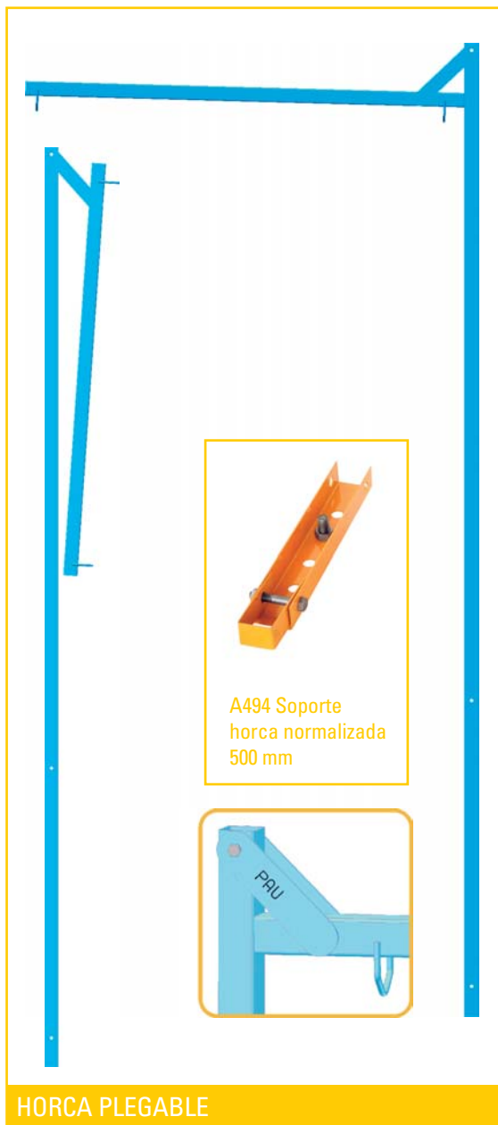
A494 Soporte horca normalizada 500 mm